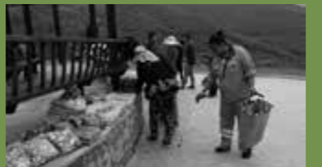
高速道路の休憩エリアにて

エクスカージョンで宿泊した観光ホテル。目の前の人口湖ではなかなかの規模のハイテク噴水ショーがありつつ、その横では台湾の十份を模した(?)ノスタルジックなランタン上げが同時進行。高速道路上の休憩エリアでは、おそらく無許可と思われる露店でおばちゃんが乾燥きのこを売り、その横でゴミ拾いの係員がすかさず落ちたゴミを拾う。色々深く考える方には中国は向かないのかもしれませんが、私はそういうところも好きです。