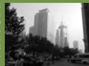
大連市人民路のまちなみ

大連市では、都市高速や地下鉄が整備され、高層ビルが建ち並び、急速に近代化・現代化の進む様子が圧倒される一方、日本の租借時代の建物と最新の高層ビル群の共存するまちなみに新旧の調和する美しさを感じました。一本路地に入れば、中低層の町屋が建ち並び、市民の暮らしが息づく、古き良きまちなみに触れることができ、歴史文化を活かしたまちづくりの重要性に改めて感じたところです。