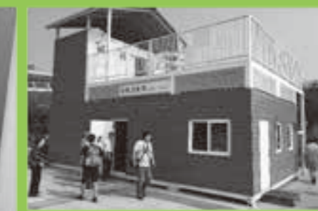
大連国際空港駐車場に整備されている公共公衆用バイオトイレ施設の全景。水洗トイレ施設は2階にあり、1階が浄化槽施設となっている。