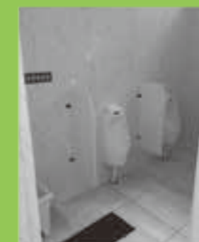
水洗トイレ内部の様子