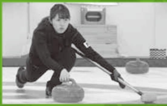
大学時代のカーリング部創部メンバー。女子は小学生から大学卒業まで15年間組んでいたチーム。

チームでのポジションはスキップ。戦術を考えて指示する司令塔であり、チームの要です。チームが新しいため、課題は山積みですが日々練習を積み重ね、4人が「ONE TEAM」となると一試合一試合を大切に戦っています。近い将来、日本中のファンが見守る中で、南の放つラストショットが栄光へと続く一筋の光となって氷上で輝く瞬間をdec職員一同が願っています。皆様、応援よろしくをお願いします!