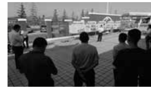
撫通高速道路永陵サービスエリア