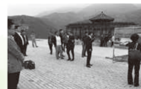
丹通高速道路瀋陽展望台