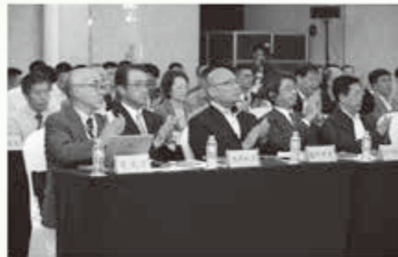
研究発表会日本メンバー席