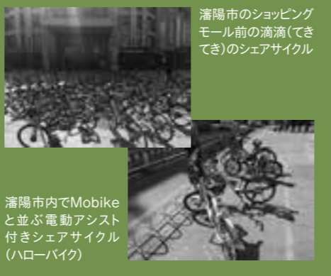
瀋陽市のショッピングモール前の滴滴(てきてき)のシェアサイクル

2016年中国ではじまった自転車シェアリングサービスが、3年後のようになったかを瀋陽と大連で観察。Mobike、ofo、ハローバイク、滴滴(てきてき)(中国版Uber)といった多種多様なバイクを発見。中国のシェアサイクルブームは今後も続くのか!?