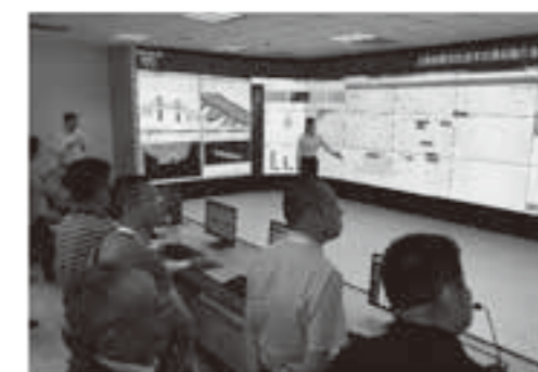
遼寧省交通計画設計研究所公路橋梁診断補修交通運輸産業研究開発センター

翌9月29日は、北朝鮮との国境都市である丹東市を經由して大連市まで500kmを南に移動し、丹通高速道路などを視察しました。途中、瀋陽展望台に立ち寄り、丹通高速道路についての説明を受けるとともに、遼寧省高速道路运营管理有限責任会社丹東支店を訪問し、遼寧省の高速道路維持管理について説明を受けました。全長196.6kmの丹通高速道路は、沿線に五女山城・高麗古墳群などの世界文化遺産が点在することから、遼寧省初の景観モデル高速道路として整備されたものであり、各所に展望台を配し、橋梁・トンネルの多く、遼寧省で1kmあたりの工事費の最も高い路線ということでした。