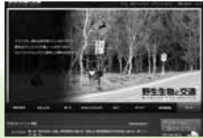
「野生生物と交通」ウェブサイト

「野生生物」と「交通」に関わる問題は、異分野間にまたがる学際的な研究テーマであるため、その情報交換の機会が極めて少ないのが現状です。「野生生物」と「交通」に関する知識の情報交換の場として、この機会にぜひご活用下さい。多くの方のご参加をお待ちしております。現在、論文発表、パネル展示、聴講、懇親会等のお申込みを受け付けております。詳しくはホームページ http://www.wildlife-traffic.jp/ をご覧ください。