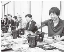
除雪活動後の地域交流会の様子

「今後、この地域でどのようなボランティア活動をしてみたいですか」という設問については、「収穫な活動の手伝い」、「地域のお祭りやイベントの手伝い」など、冬だけでなく、別の季節にもボランティアをしてみたいという声が見られました。また、「今後、参加してみたい交