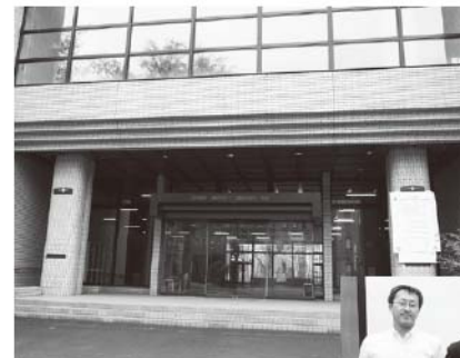
会場の北海道大学学術交流会館

本業のハイドレート研究としては、人工的に生成するなど、より基礎的な物性の研究をしたいと思っています。また、天然のハイドレートは海底、湖底、雪氷のなかなど極めて特殊なところにあつてなかなか採取できないわけですが、そういう難しい取り組みのなかで新しい研究の芽が見つかるかもしれません。いろいろなところに面白い研究対象が落ちていそうなので、どんどん調べてやるぞ、という気持ちですね。