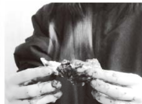
バイカル湖の燃える天然ガスハイドレート(実際に燃えている様子)

南海トラフでハイドレートの試験生産をしようとしています。天然ガス資源としてのメタンハイドレート開発については、日本が世界で最も先進的と言えるでしょう。