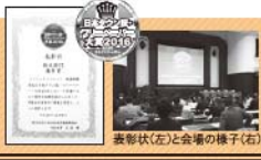
表彰状(左)と会場の様子(右)

編集後記 全国各地のタウン誌やフリーペーパーの誌面クオリティや読者の支持率など、多彩な視点から審査し、評価の高い媒体を選定して表彰するイベント「日本タウン誌フリーペーパー大賞2016」が、観光部門にエントリーした我が「Scenic Byway」は、この度めでたく優秀賞を授賞！2016年12月1・2日、東京の国立科学博物館で行われた授賞式に参加してきました！残念ながら、観光部門の大賞である「観光庁長官賞」は逃してしまいましたが、全国の優れた媒体を目的の当りたりにして、課題は勿論ありますが、「Scenic Byway」は内容、デザインともに決して他を引けを取らない媒体であると実感しました。携わっているみなさんとともに、より一層充実した紙面を作っていくお手伝いが少しでもできたら、と強く思いました！(RW)