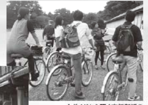
↑ガイドから聞く京都御所の 特徴や歴史の随