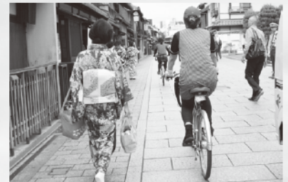
↑祇園の街を自転車で 観光と走る

ツアーを通して、自転車ツアーは、点と点の観光地めぐりではなく、面での観光地めぐりを体験できることに大きな良さ・メリットがあるのだと感じました。また、地元ガイドが場所ごとに