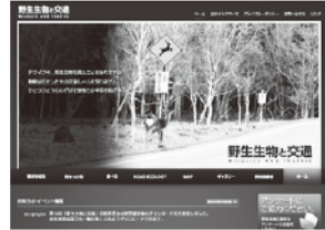
「野生生物と交通」ウェブサイト

編集後記 全国各地のタウン誌やフリーペーパーの誌面クオリティや読者の支持率など、多彩な視点から審査し、評価の高い媒体を選定して表彰するイベント「日本タウン誌フリーペーパー大賞2016」が、観光部門にエントリーした我が「Scenic Byway」は、この度めでたく優秀賞を授賞！2016年12月1・2日、東京の国立科学博物館で行われた授賞式に参加してきました！残念ながら、観光部門の大賞である「観光庁長官賞」は逃してしまいましたが、全国の優れた媒体を目的の当りたりにして、課題は勿論ありますが、「Scenic Byway」は内容、デザインともに決して他を引けを取らない媒体であると実感しました。携わっているみなさんとともに、より一層充実した紙面を作っていくお手伝いが少しでもできたら、と強く思いました！(RW)