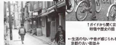
←生活の匂いや音を感じられる、 京都の古い街並み

興味深い説明をしてくれたことが、その街の歴史や文化を知ることにつながる重要なポイントとなっていることが分かりました。