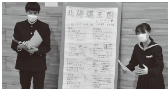
「総合的な探究の時間」のポスターセッションの様子②

集う研究会へのアプローチが有益だと思います。例えば、今年度から「地理総合」という科目ができ、1年生で必修になりました。地理が必修になったのは画期的なことで、少ない地理専門の先生が各地で奪い合いになっているぐらいですが、「地理総合」を教える上でもほっかいどう学の内容は役立つと思います。