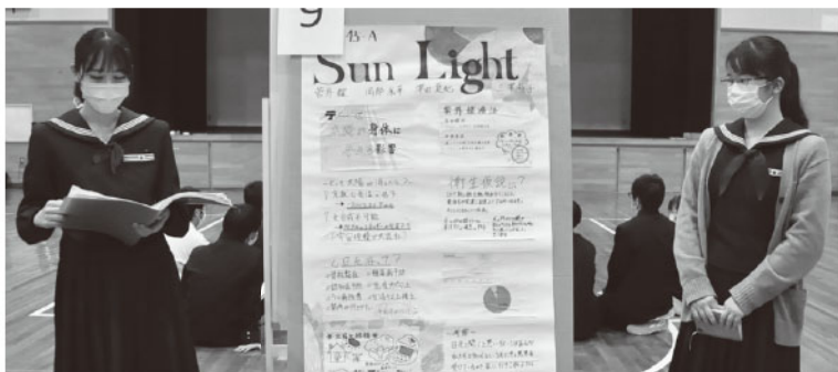
「総合的な探究の時間」のポスターセッションの様子①

私が考えるには、例えばNPOがウェブでプラットフォームを設け、そこに「学校に対して、こんな貢献ができます」とい