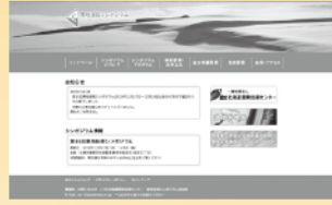
「寒地技術シンポジウム」ウェブサイト

第38回寒地技術シンポジウムを 札幌市(会場:札幌市教育文化会館)で開催いたします。 寒地技術に関心を持つ多くの皆さまのお申込み、 ご参加をお待ちしております。 詳しくはホームページ http://www.decnet.or.jp/project/ctc/ をご覧ください