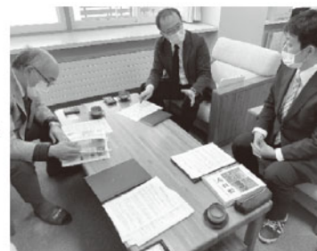
学校教員へのヒアリング調査の様子

これらの調査結果を踏まえ、学校現場におけるインフラに関する学習の実態を把握することを目的として、小学校教員へのヒアリング調査を実施しました。その結果、インフラ学習を進めるにしても、地域として何を扱えばよいのかわからない、インフラに関する資料収集が困難。すぐに使える教材（スライドや指導計画、板書計画など）が欲しい、また、そもそも教員の多忙化、専門的な人材不足により副読本の作成が大きな負担になりつつあるといった声が聞かれ、インフラ学習を推進する上での課題が浮かび上がりました。