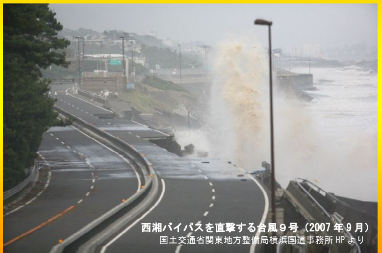
西湘バイパスを直撃する台風9号(2007年9月)

『リスクマネジメントの本質を知る』(共著 2006) 「道路橋基礎の設計基準化に関する研究と展望」 (土木学会論文集招待論文 2005)