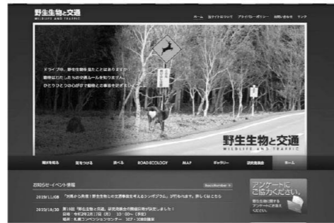
「野生生物と交通」ウェブサイト

http://www.wildlife-traffic.jp/ をご覧ください。