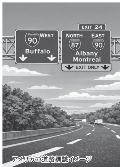
アメリカの道路標識イメー

今回得られた知見や気づきを、今後の研究・業務にしっかりと還元し、北海道、そして日本の道路交通政策や技術開発に貢献していきたいと考えています。改めて、このような貴重な機会をいただいたことに感謝するとともに、今後一層、「多視点、という、未来志向」を意識して業務に取り組んでまいります。