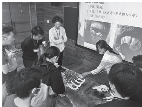
「シカ捕獲認証制度」受講の様子

また、地域の狩猟者に対する捕獲技術の研修、シカの肉質向上のための処理に関する調査などを行っています。このほか、野生動物対策犬に関する調査や一般向けの普及啓発活動では「えぞしかるた」の制作・販売、SNSによるシカ肉料理動画の配信なども行っています。