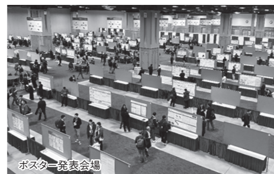
ポスター発表会場

TRB Annual Meeting は、道路・交通分野における世界最大級の国際会