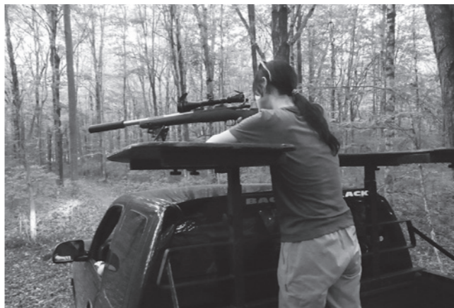
写真左: シカ捕獲のための狙撃訓練(アメリカコネチカット州) 写真右: エゾシカ捕獲手法検討に係る現地調査(知床岬)

最近、シカの増加でクマがシカを捕食するようになり、それがクマ増加の一因になっているのではないかと、言われることがあります。しかし、これをはっきり示す証拠は出ていません。確かに生まれたばかりの子シカや交通事故などで弱ったシカを襲うことはあり、シカの利用が増えたという食性分析結果はありますが、全体的な傾向としてははっきりしたことはまだわからないですね。